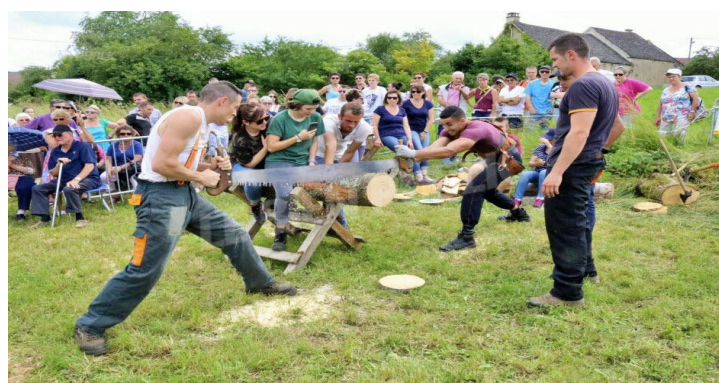
> Les découpeurs